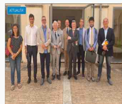
DIRIGENTE TERRITORIALE ANF