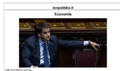
04/20/2023 20:34 PNRR, il giorno delle parti sociali. Fitto: "Lavoriamo per aggiornare rapidamente Piano" (Teleborsa) - Prosegue il lavoro del Governo sul PNRR dopo il via libera definitivo del Parlamento al dl PNRR, che contribuisce a rafforzare e valorizzare il dialogo con le parti sociali, trasferendo alla Cabina di regia PNRR - organo di indirizzo politico che coordina e dà impulso all'attuazione del Piano - le interlocuzioni precedentemente attribuite al Tavolo tecnico. Oggi è stata la volta delle pareti sociali: sei tavoli settoriali a cui hanno partecipato Confindustria, Ance, Confedilizia, Abi, Ania, Coldiretti, Confagricoltura, Cia, Unsic, Copagri, Federterziario, Confetra, Confservizi, Confprofessioni, Assoprofessionisti, Confapi, Confimi, Confcommercio, Confesercenti, Federdistribuzione, Alleanza Cooperative, Unicoop, Confartigianato, Cna, Casartigiani, Cgil, Cisl, Uil, Ugl, Confsal, Cisaal, Usb. "Con le riunioni di oggi della Cabina di Regia con i rappresentanti delle imprese e dei sindacati diamo una prima risposta concreta a quanto previsto dal decreto. Come metodo abbiamo impostato una serie di tavoli settoriali specifici per entrare nel merito delle questioni e garantire a tutti tempistiche adeguate al confronto", ha spiegato il Ministro Raffaele Fitto al termine degli incontri che si sono svolti questo pomeriggio a Palazzo Chigi. Il Ministro ha anche tracciato la roadmap e le tempistiche per i prossimi mesi. "Stiamo lavorando intensamente per verificare gli interventi e gli eventuali correttivi sia sul capitolo del REPowerEU sia sull'intero Piano. Riteniamo doveroso farlo subito anche con il vostro coinvolgimento", ha detto Fitto ai rappresentanti di imprese e sindacati, con cui intende proseguire il dialogo, in vista della presentazione dell'aggiornamento del PNRR alla Commissione europea entro il 31 agosto. Lavoriamo per poter raggiungere questo risultato il prima possibile: stiamo procedendo rapidamente con la consapevolezza dell'importanza di dover cogliere questa grande sfida per il Paese", ha garantito il Ministro, ricordando che la prossima settimana ci saranno l'informativa sul PNRR in